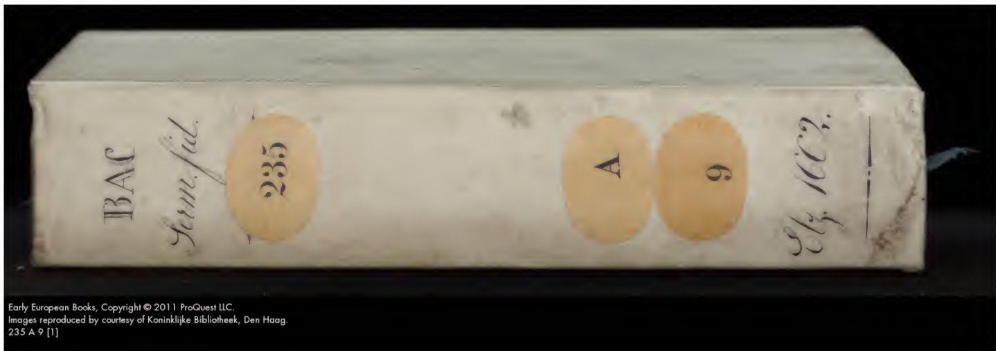
235 A 9 [1]